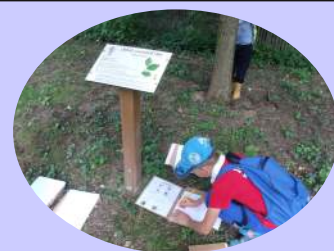
"Les jeunes repor'Terre en pleine réalisation de leur herbier"

"Franchement, au parc des Moulins, on y reviendra!"